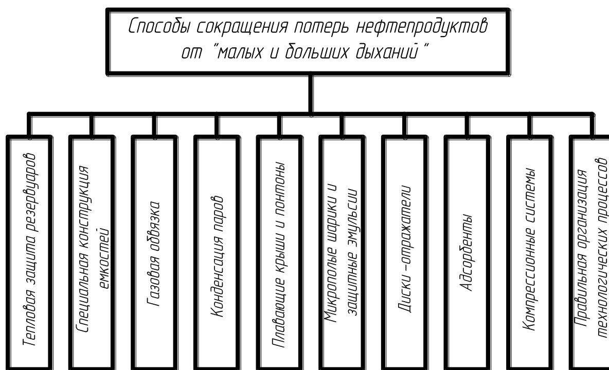
Рисунок 1 – Способы сокращения потерь нефтепродуктов от испарения

Классификация способов сокращения потерь нефтепродуктов от испарения выглядит следующим образом (рис. 1).