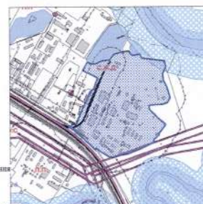
Чертёж градостроительного плана земельного участка разработан на топографической основе в масштабе М 1:1000, выполненной (дата, организация):